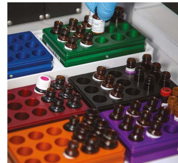
PS-10-Racks fassen bis zu 90 Antikörper-Reagenzien