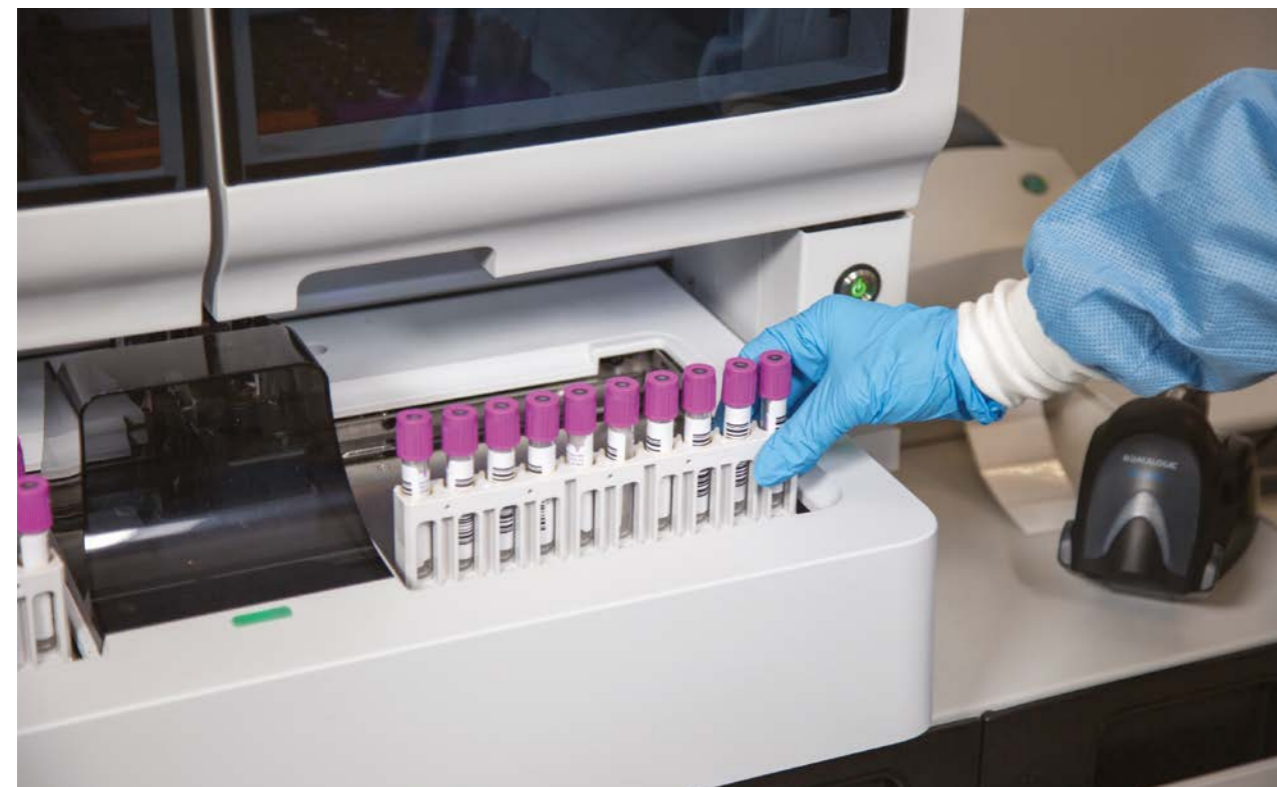
Effizientes Laden der Patientenproben mittels Autosampler