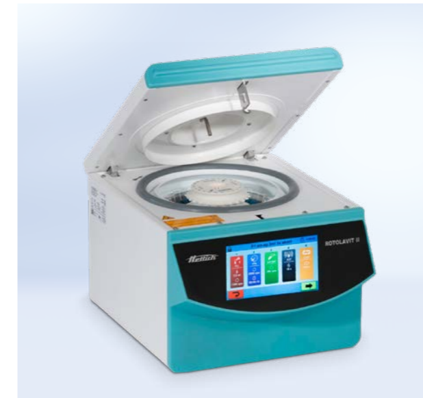
Die Waschzentrifuge ermöglicht bis zu 20 verschiedene Programme