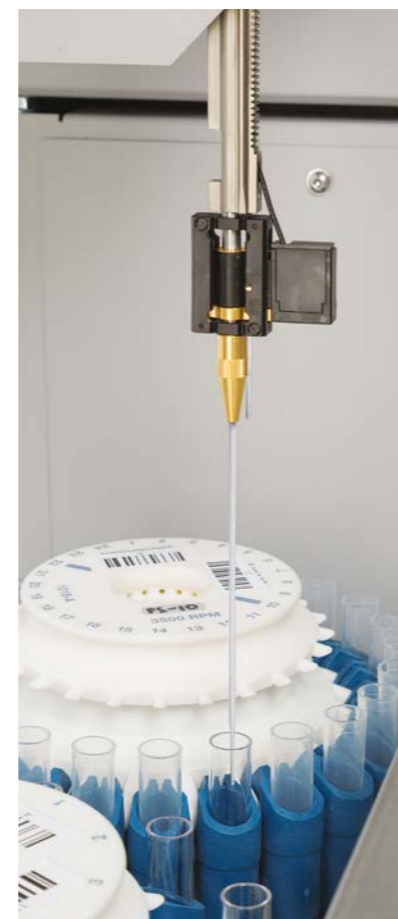
Zwei Pipettieradeln für schnellen Durchsatz