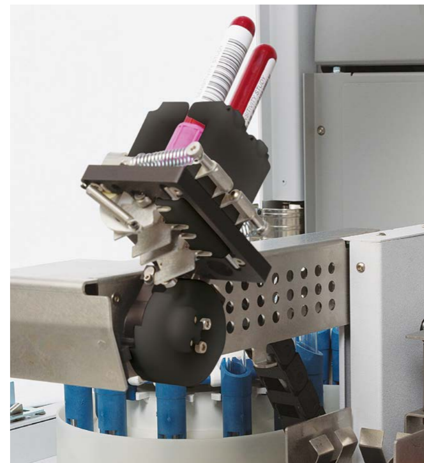
Automatisiertes Mischen der Patientenprobe