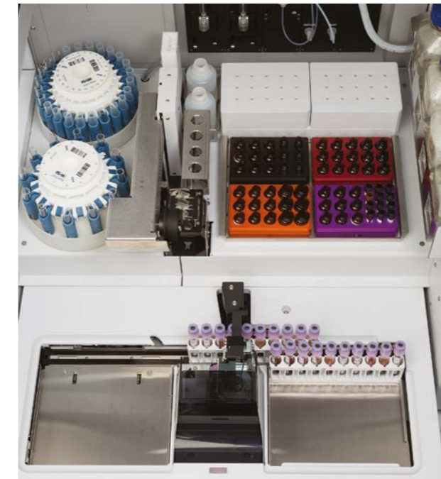
Nutzung von Reagenzien auch von anderen Herstellern möglich